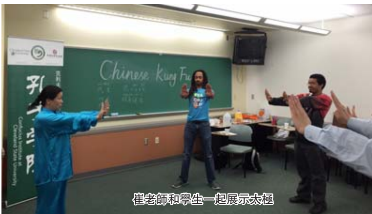
崔老師和學生一起展示太極

子曰:“文武之道,一張一弛。”十分鐘的基本功,讓大家大汗淋漓,接著便是放鬆休息時間。一些未盡興的同學單獨找崔老師諮詢,還