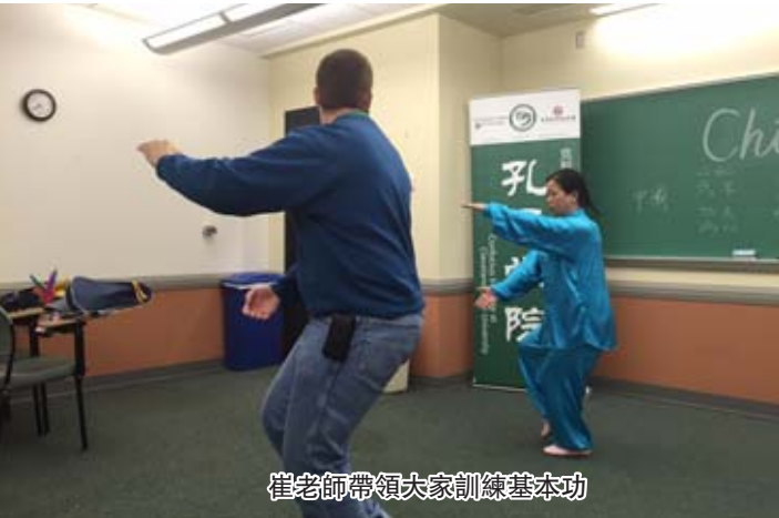
崔老師帶領大家訓練基本功